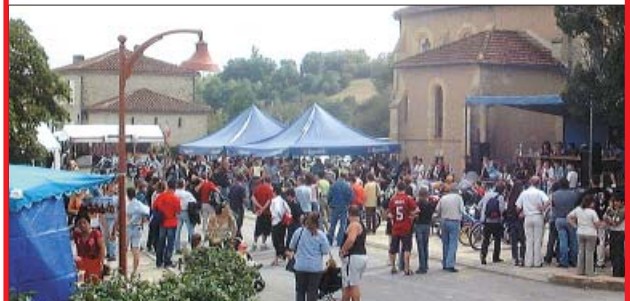
Reportage : Abe Van Lemmingh

4 e Show Bike à Maignaut-Tauzia Fête désormais traditionnelle du second week-end de septembre, sa version 2004 a bénéficié d'un temps somptueux. Au menu : concerts rock, concours de motos et une aimable surprise largement dévoilée.