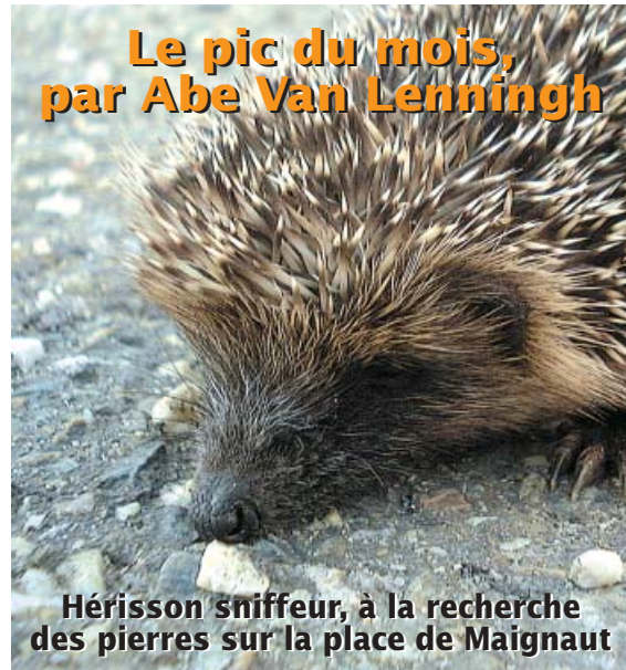
Hérisson sniffeur, à la recherche des pierres sur la place de Maignaut